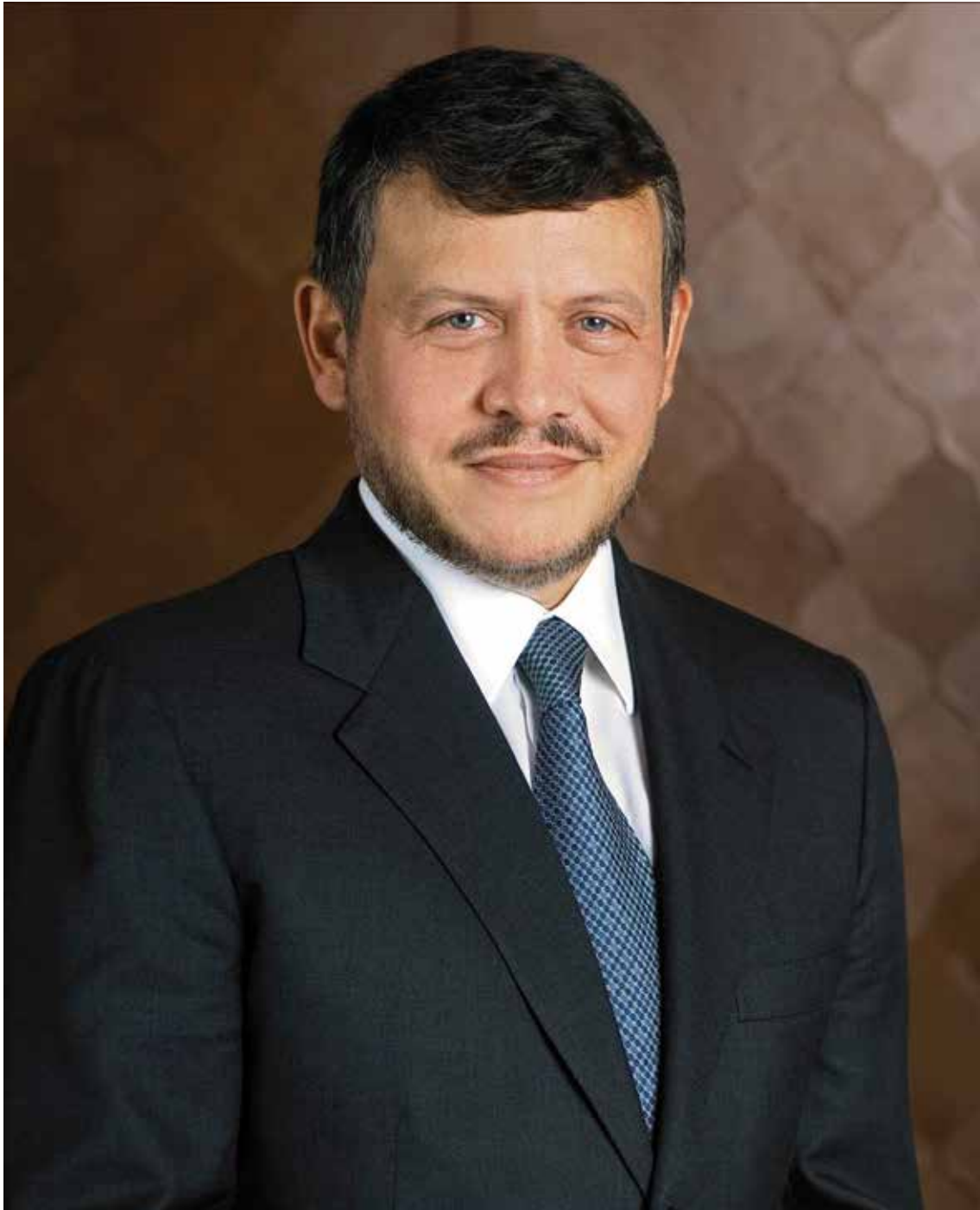
صاحب الجلالة الهاشمية الملك عبدالله الثاني بن الحسين المعظم حفظه الله ورعاه