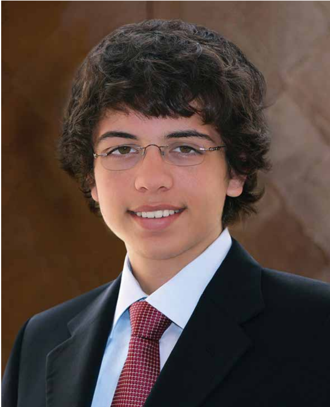
صاحب السمو الملكي ولي العهد الأمير حسين بن عبدالله الثاني المعظم حفظه الله ورعاه