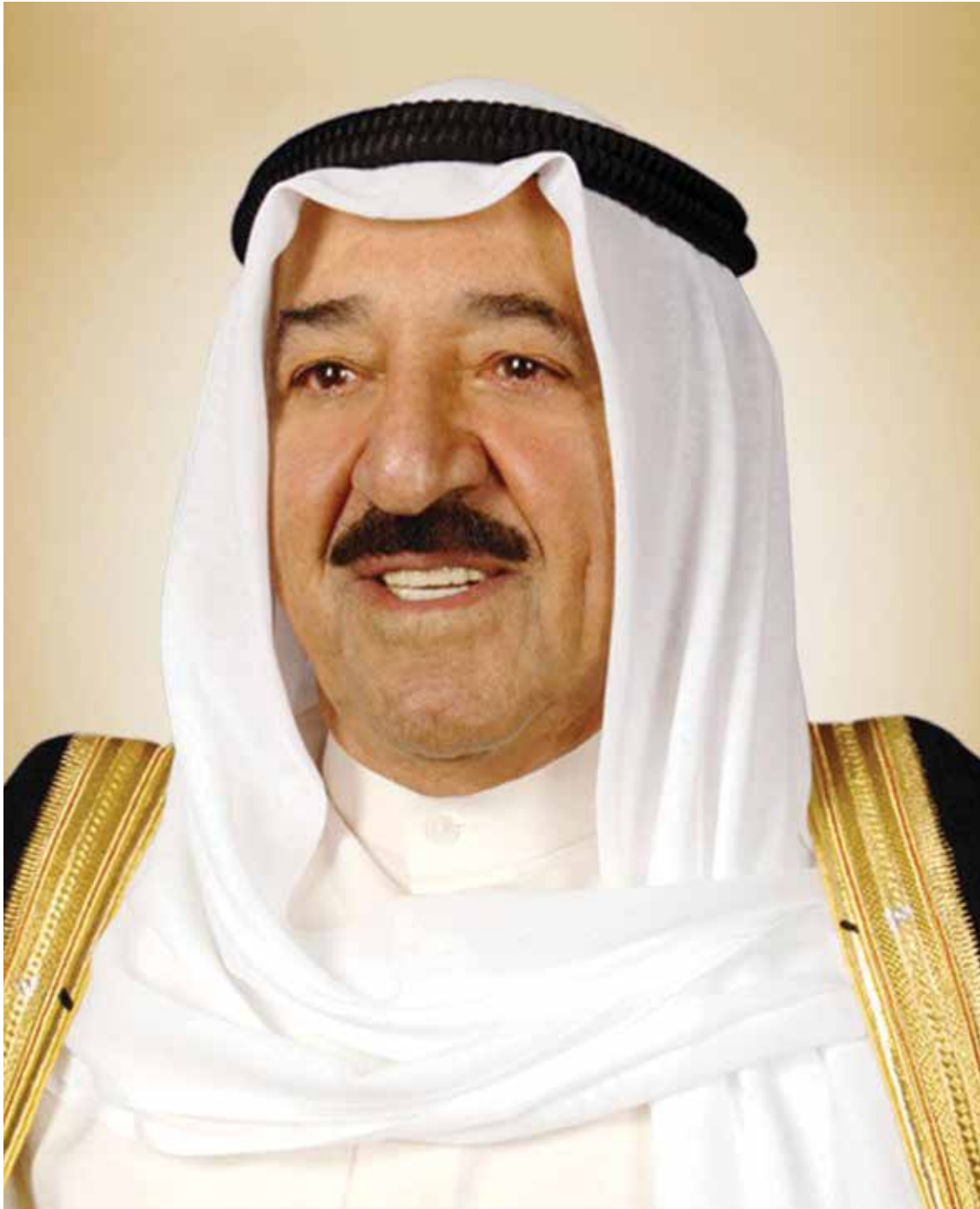
حضرة صاحب السمو الشيخ صباح الأحمد الجابر الصباح أمير دولة الكويت حفظه الله ورعاه